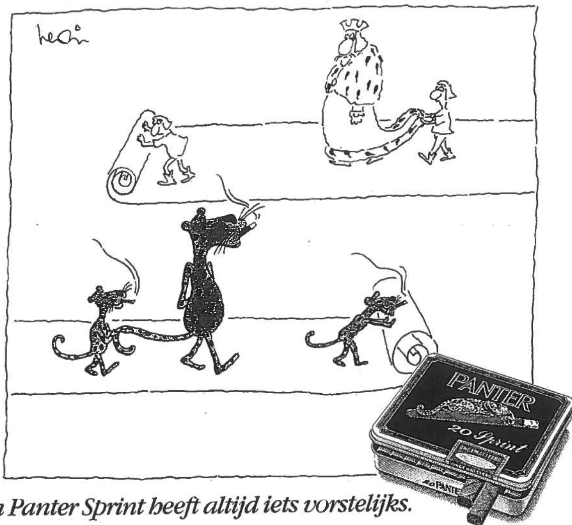
Een Panter Sprint heeft altijd iets vorstelijks.